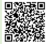
「ラーケーションの日」活動例