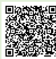
「ラーケーションの日」ポータルサイト

「ラーケーションの日」には、様々な活動ができます。どのような活動ができるのか、どうやって「ラーケーションの日」を取ればよいのかなど、興味をもった人は、おうちの方に配った「保護者用リーフレット」を見たり、右の二次元コードから、「ラーケーションポータルサイト」を見たりしながら、おうちの方と話し合ってください。