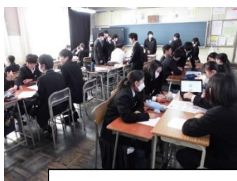
進路学習につなげるすごろくゲームの様子