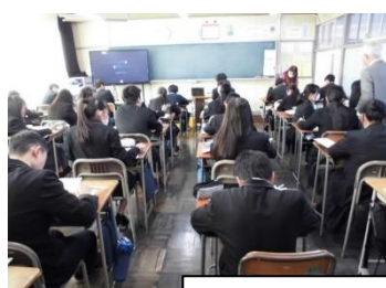
「卒業後の進路」調べ学習