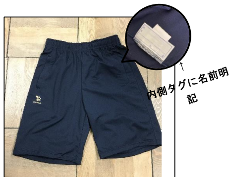
クォーターパンツ