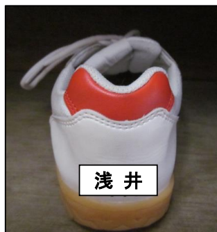
体育館用シューズ （かかと部分に記名）