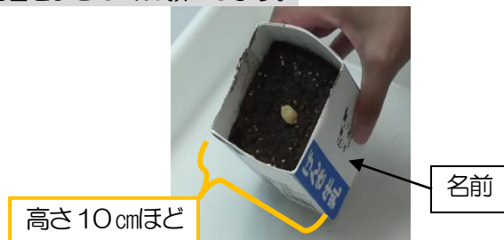
【ヒョウタンの種まき】