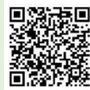
「ラーケーションの日」活動例