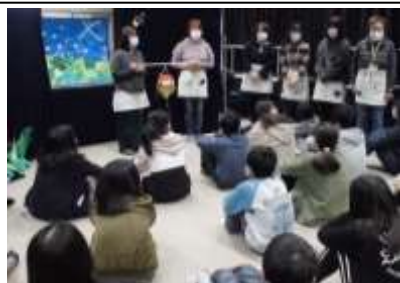
大型絵本「読み聞かせ」