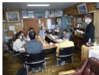
第5回学校運営協議会

去る2月22日(月)に、本校の第5回学校運営協議会を、校長室にて開催しました。教育活動に関するアンケートの結果等から、学校評価を行い、今年度の成果と次年度に向けての課題について協議しました。同時に、コロナ禍ということで、千秋中学校区学校運営協議会の全体会を書面開催し、今年度の活動報告と次年度の計画について協議しました。地域の皆様には、今後もより一層ご支援ご協力をいただきますよう、よろしく申し上げます。