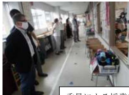
委員による授業参観