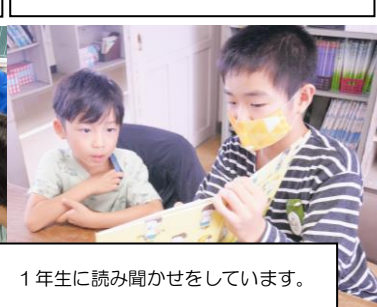
1年生に読み聞かせをしています。