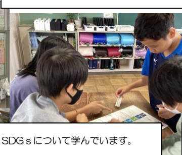
SDGsについて学んでいます。