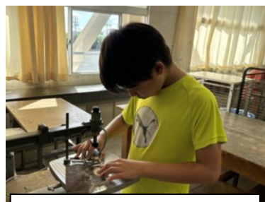
糸のこざりを上手に使っています。