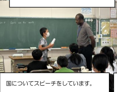
国についてスピーチをしています。