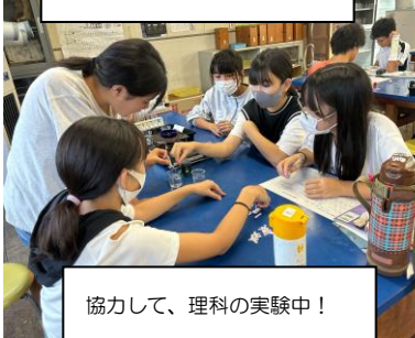
協力して、理科の実験中！