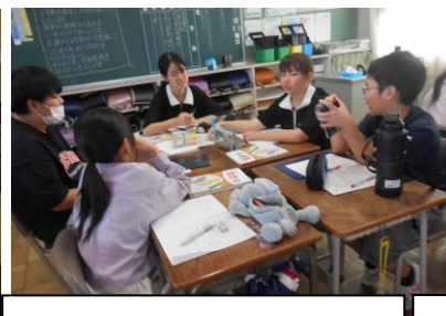
算数の学習で話し合いをしています。