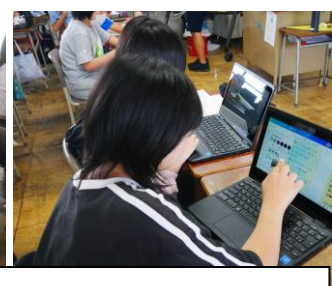
『やまなし』の意見交流をしています。