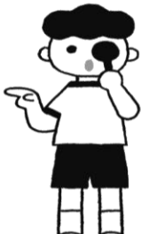
し り ゃ く けん さ 視力検査