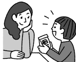
か ぞ く ひ と は な 家族の人に話しておく