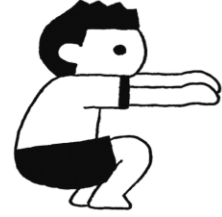
うんどう き けんしん 運動器検診