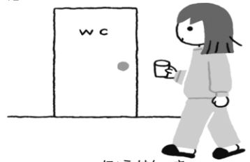
に ょ う けん さ 尿検査