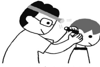
じ び か けんしん 耳鼻科検診