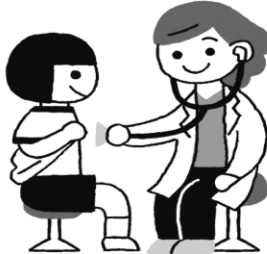
ない か けんしん 内科検診