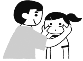
がん か けんしん 眼科検診