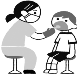
し か けんしん 歯科検診