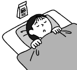
よう き まくらもと お 容器を枕元に置いておく