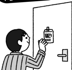
よう き とびら は 容器をトイレの扉に貼っておく