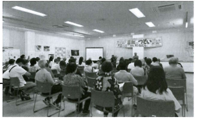
昨年8月の「2025 一宮・平和のつどい」