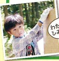
わたしたちのひみつきち!

食事: 朝2/昼2/夕2 宿泊施設: 乗鞍青少年交流の家 定員: 40名 参加費用: 44,800円