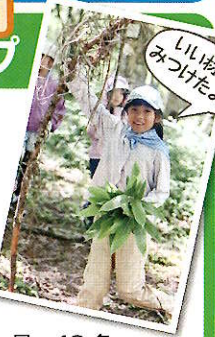
いい材料みつけたよ!

食事: 朝2/昼2/夕2 宿泊施設: 乗鞍青少年交流の家 定員: 40名 参加費用: 44,800円