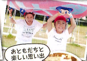
おともだちと楽しい思い出

食事: 朝1/昼1/夕1 利用施設: 芝政ワールド 宿泊施設: 福井県坂井市周辺宿泊施設 定員: 60名 参加費用: 46,800円