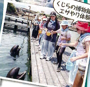
くじらの博物館でエサやり体験

食事: 朝2/昼2/夕2 利用施設: くじらの博物館 ドルフィンベイブ 宿泊施設: 潮岬青少年の家 定員: A・Cコース 36名 Bコース 24名 参加費用: 57,800円