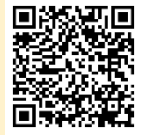
アジアパラ競技大会 公式チケットインフォメーション

※ 二次元コードからアクセスできる Web サイトで応援 ID を登録すると、競技大会の日程などを確認できます。