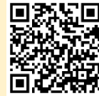
アジア競技大会 公式チケットインフォメーション