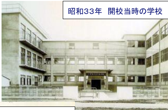
昭和33年 開校当時の学校