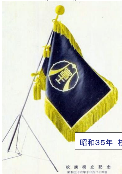
昭和35年 校旗樹立 記念絵葉書