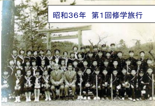
昭和36年 第1回修学旅行