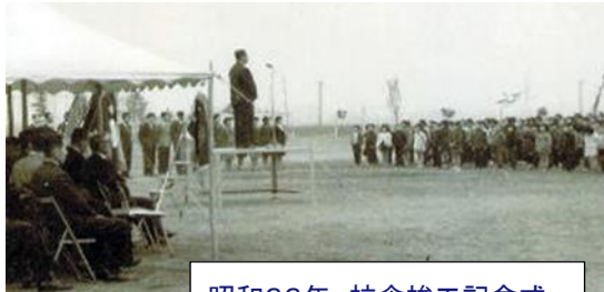
昭和33年 校舎竣工記念式