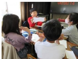
【国語 ひみつの言葉】