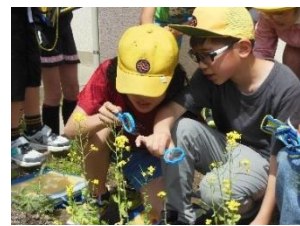
【理科 アブラナ観察】