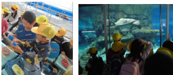
3年生 名古屋市科学館