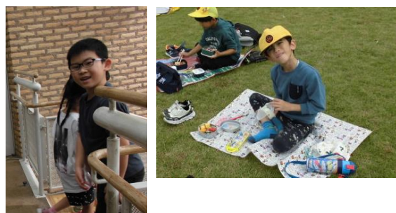
4年生 木曽三川公園