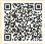
「ラーケーションの日」活動例