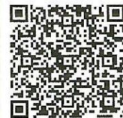
「ラーケーションの日」ポータルサイト

「ラーケーションの日」には、様々な活動ができます。どのような活動ができるのか、どうやって「ラーケーションの日」を取ればよいのかなど、興味を持った人は、おうちの方に配った「保護者用リーフレット」を見たり、右の二次元コードから、「ラーケーションポータルサイト」の「『ラーケーションの日』活動例」を見たりしながら、おうちの方と話し合ってください。