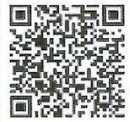
「ラーケーションの日」活動例