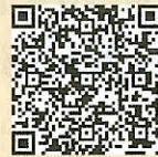
「ラーケーションの日」ポータルサイト

※ 県の Web ページ「ラーケーションの日」ポータルサイトには、計画づくりに活用できる「ラーケーションカード」や、様々な学びを体験できるスポットや活動例などを紹介していますので、参考にしてください。