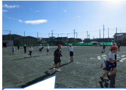
ペースを意識してがんばろう