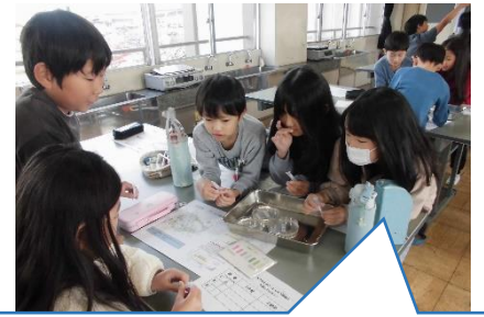
川の水を汚してしてしまうのは・・・