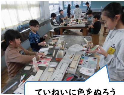
ていねいに色をぬろう