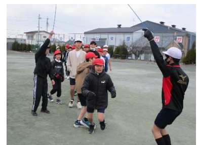
1月24日(土) なわとび授業公開の様子

寒い中、「浅野っ子展」、「なわとび授業公開」をご参観いただきありがとうございました。子どもたちは、練習の成果を精いっぱい発揮していました。