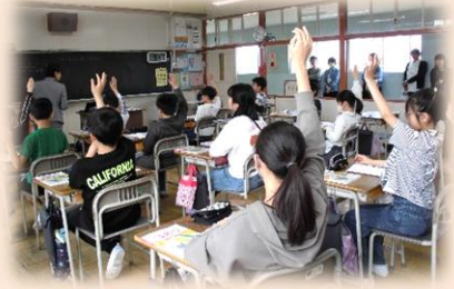
今回の学校公開の評価(アンケート結果)