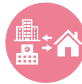
関係機関と 連携した支援