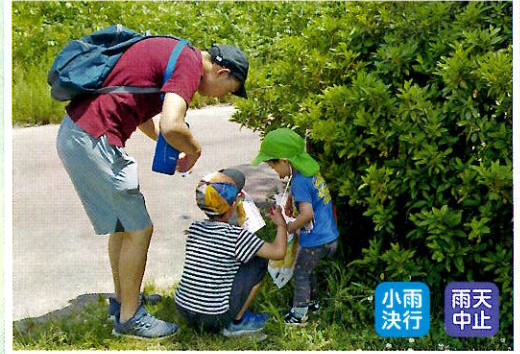
小雨 決行 雨天 中止

自然いっぱいのフィールドを利用した2つのコース(初心者コース・チャレンジコース)を設定し、安心して楽しめるオリエンテーリング体験を実施します。