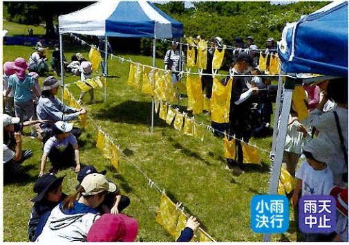
小雨 決行 雨天 中止

みなさんと協力して特定外来生物であるオオキンケイギクを抜き取り、その花びらを使ってハンカチ染めをします。染めたハンカチはお持ち帰りいただけます。