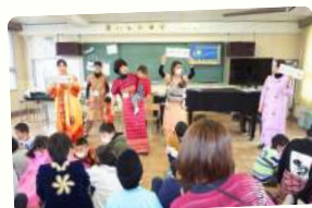
一宮市にて、国際理解授業