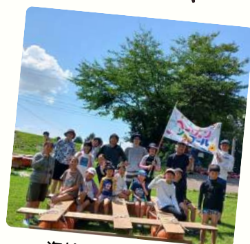
海外ゲストと過ごす サマーキャンプ