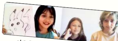
オンラインでも国際交流 (小5)