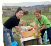
ホームステイ交流で モンゴルにも娘ができた！