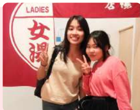
インドネシアの大学生 Cちゃんが来てくれたよ(中2)