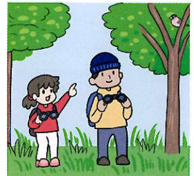
イラスト: ぬまがさわタリ