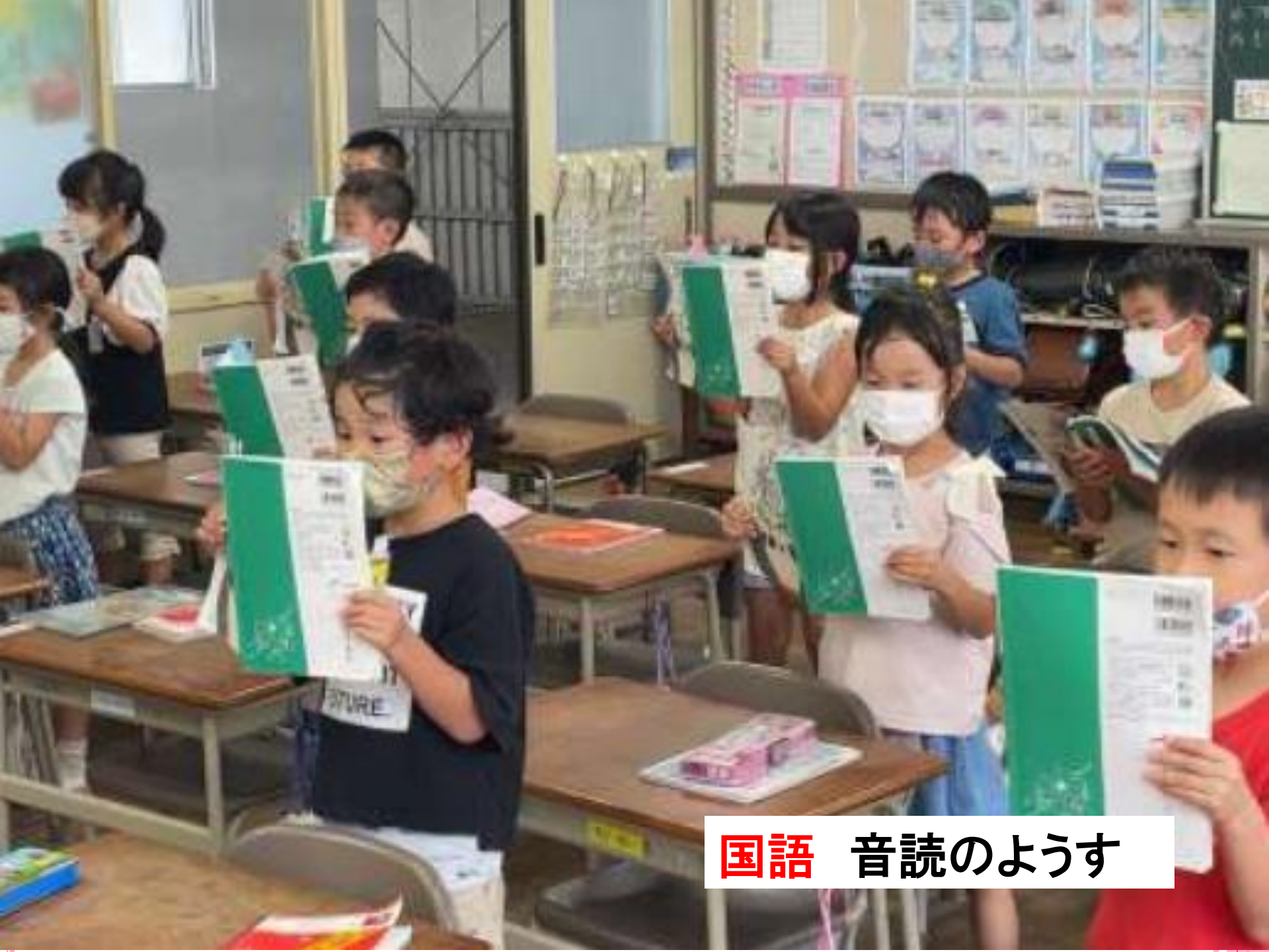
国語 音読のようす