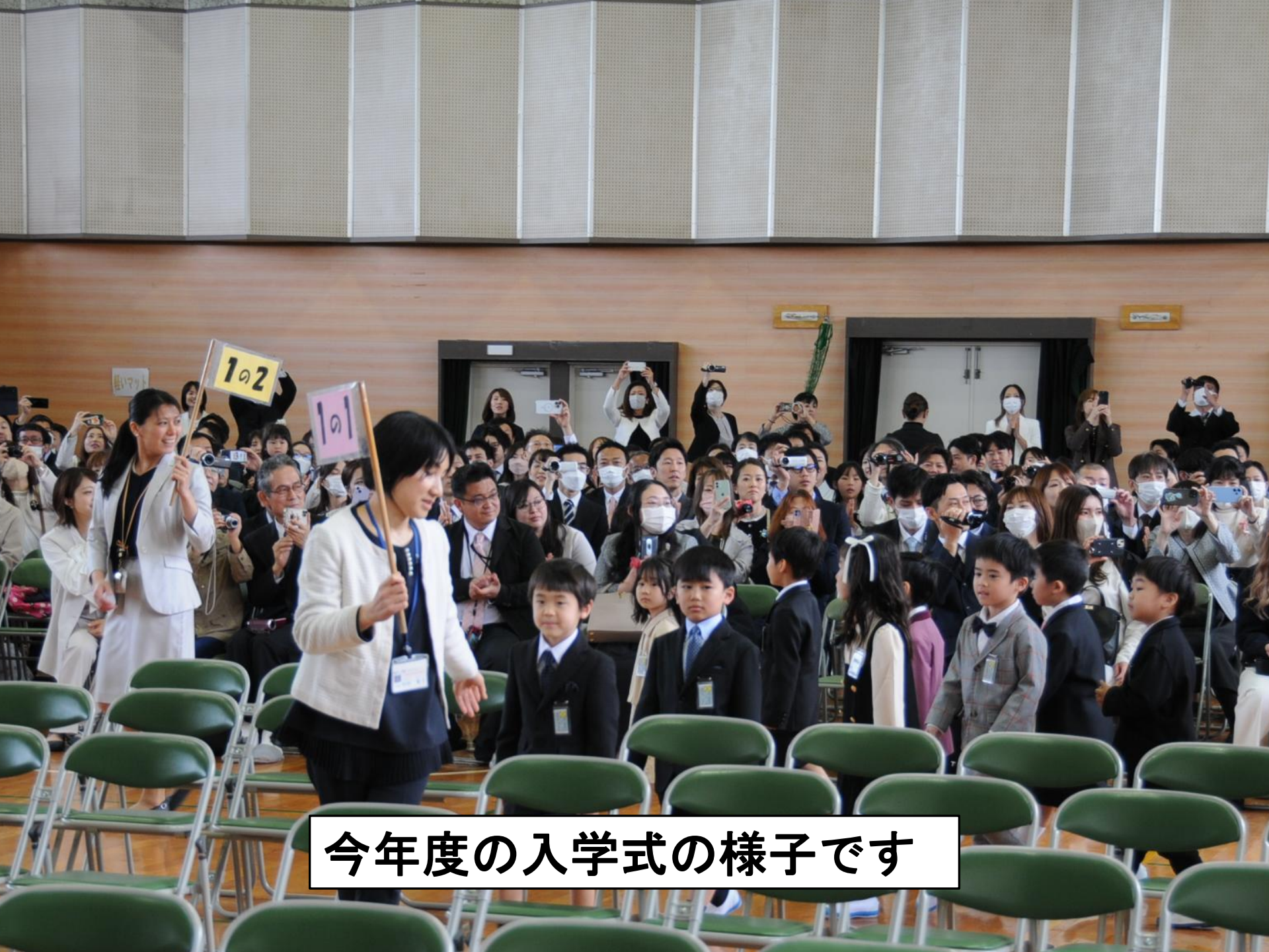
今年度の入学式の様子です