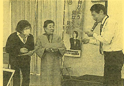
上記の写真は昨年度の青少年育成アドバイザー研究集会in岡崎の様子