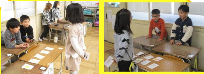
国語「ものの名まえ」