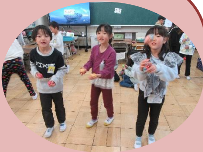
生活科「むかしからつたわるあそび」