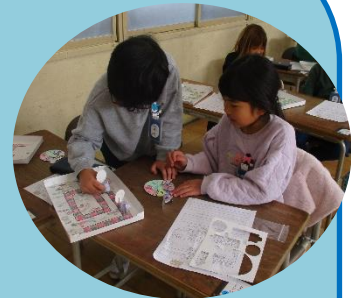
図工「わくわくおはなしすごろく」